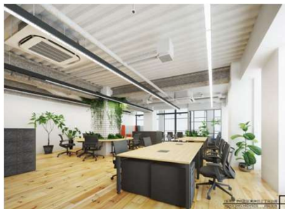
内観イメージパース